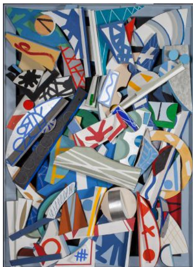
Jan Voss, sans titre , collage sur bois, 2001

Pour un musée en Palestine , exposition orchestrée par l'artiste Ernest Pignon Ernest, préfigure la création d'un Musée d'art moderne et contemporain en Palestine.