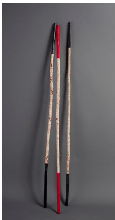
Serge Pey, Bâtons de marche et de poésie pour la parole du peuple palestinien , bâtons de noisetier- païper-encre, 2012 - Courtesy Association d'art moderne et contemporain en Palestine

Le 16 octobre 2015, le Président de l'Institut du monde arabe Jack Lang et l'Ambassadeur de la Palestine auprès de l'UNESCO Elias Sanbar signaient un partenariat pour œuvrer à la création d'un Musée d'art moderne et contemporain en Palestine .