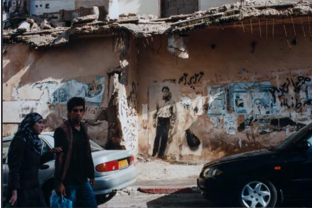
Ernest Pignon Ernest, Parcours Mahmoud Darwich, dessin papier, 2008-2009

Membre actif de l'Association pour l'Art moderne et contemporain en Palestine, l'artiste Ernest Pignon Ernest renoue ici avec l'engagement pris contre l'apartheid qui l'avait amené à initier le « Musée de l'exil » réunissant une dizaine d'artistes internationaux et itinérant dans 48 pays jusqu'à l'abolition de la ségrégation en 1991. Le Musée d'art moderne et contemporain en Palestine est selon ses mots « l'affirmation d'un Etat en soi mais aussi dans ses relations avec les autres Etats. »