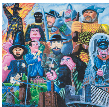
Herve Di Rosa, Sans Titre , 2003, 108 x 77 cm Lithographie EA 26/30

Parallèlement à cet enrichissement, a débuté la prospection du terrain sur lequel s'élèveront les futurs bâtiments du Musée. Suivant la même démarche que pour la constitution de la collection à savoir le principe du don solidaire, les premiers contacts avec de grands architectes ont été noués pour envisager les modalités de leurs contributions. Les premières réponses sont positives et encourageantes.