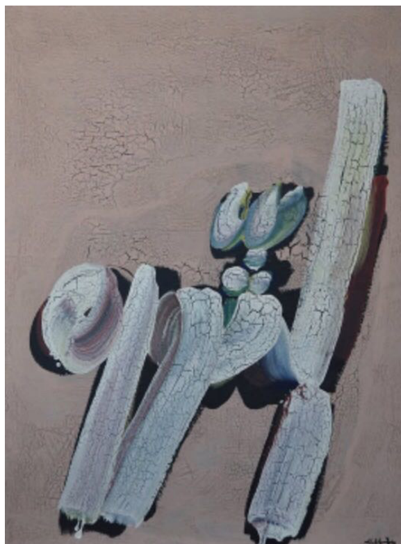
Hamed Abdalla, Al-Thawra (Révolution) , 1968, technique mixte sur toile, 130 x 97 cm

Vernissage presse le vendredi 9 mars de 11h à 13h