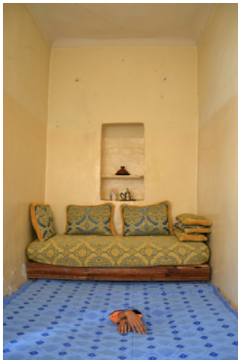
Série « The Hole », 2015 © Hicham Benouhoud