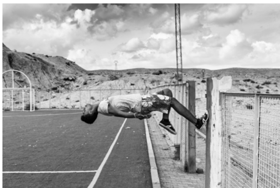
Oumm Laarayes , 2015

Retrouvez toutes les informations en ligne sur le site de la Biennale : biennalephotomondearabe.com