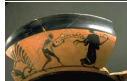
Tesson attique à la figure noire. Blakhiyah, début du V e s. av. notre ère.