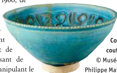
Coupelle bicolore inscrite en coufique, Iran, XI e siècle.