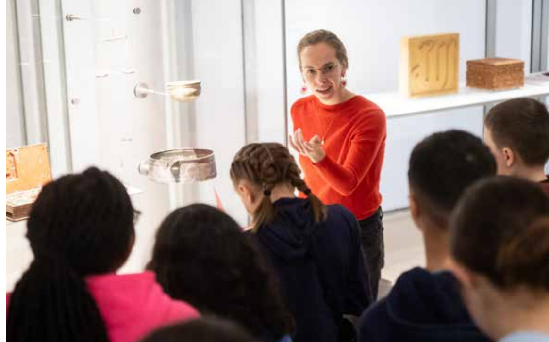
Visite scolaire au musée de l'IMA.

Trois plateaux successifs jalonnent le parcours : autant d'univers singuliers, exprimant pleinement toute la pluralité du monde arabe en termes d'ethnies, de langues, de confessions et de traditions culturelles.