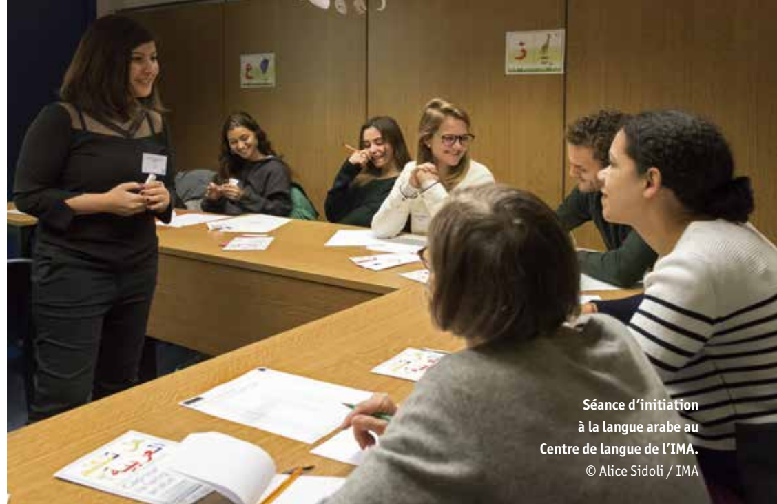
Séance d'initiation à la langue arabe au Centre de langue de l'IMA.

Premiers pas dans la langue et la culture arabes au fil d'une approche ludique, basée sur la communication orale, en chansons, comptines, jeux et contes : session annuelle,