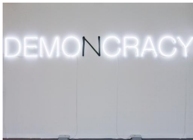
Kader Attia, Demo(n)cracy , 2010, installation avec néons.

Pour la première fois en France, l'Institut du monde arabe présente l'une des plus belles collections d'art moderne et contemporain arabe, celle de la Fondation Barjeel située à Sharjah aux Emirats arabes unis. Ce fonds d'une immense richesse rend hommage à l'énergie créative de la scène artistique arabe en réunissant les grandes signatures, de Baya à Kader Attia.