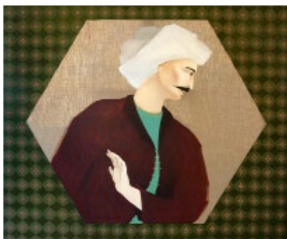
Hayv Kahraman, Khosrow , Huile sur lin, 2009

En 2017, l'Institut du monde arabe poursuit son travail de valorisation et de diffusion de la culture arabe à travers deux expositions patrimoniales majeures et la présentation d'une collection privée exceptionnelle. L'IMA fêtera également ses 30 ans dans un écrin rénové.