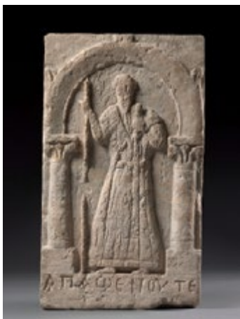
Stèle représentant Apa Shenoute, Sohag (Égypte), V e siècle, calcaire