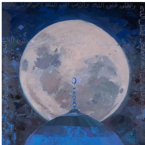
Printemps éternel, 2018 © Courtesy de l'artiste – Abdulqader al Rais aquarelle sur papier, 200 x 200 cm

Sera présentée pour la première fois l'œuvre intitulée « Printemps éternel » en hommage à la mémoire du défunt Cheikh Zayed, fondateur des Emirats, dont le pays célèbre cette année le 100 ème anniversaire de naissance.