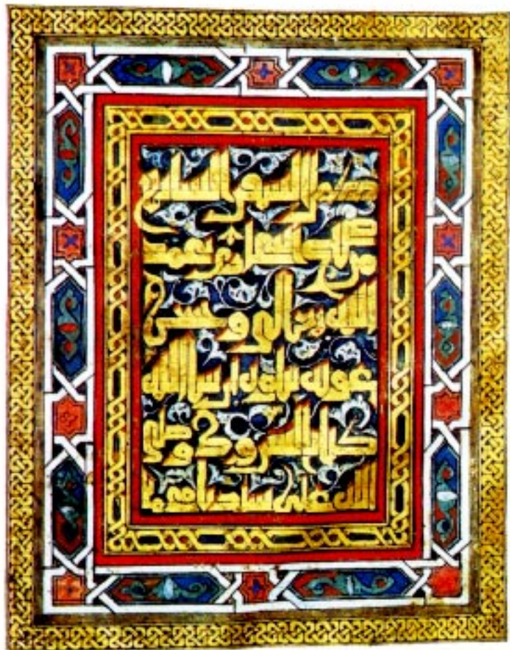
Enluminure du Maghreb, XIV e siècle.

De même, les enluminures de l'Occident musulman ne comportent pas d'éléments zoomorphes ou anthropomorphes. Habituellement, les pages de titre, les fins de chapitres et