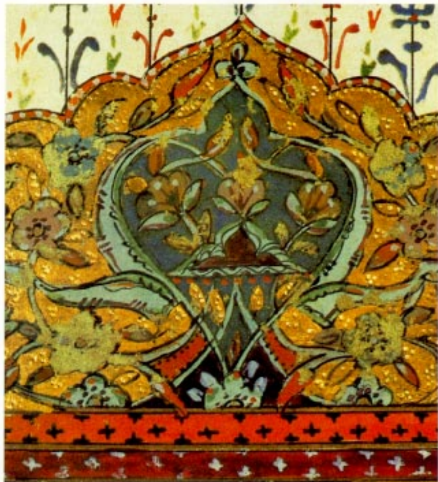
Enluminure du Maghreb, XIX e siècle.

Au Maghreb, trois familles de calligraphies sont utilisées :