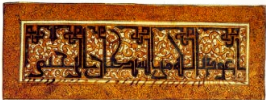
Calligraphie koufi .

Le koufi , du VIII e siècle au XII e siècle ; Le koufi maghribi , prédominant jusqu'au XV e siècle et le maghribi , en usage jusqu'à nos jours.