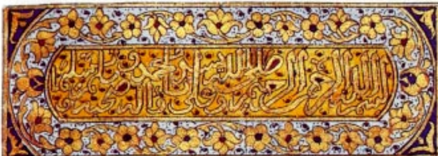
Calligraphie maghribi .