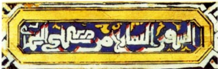
Calligraphie koufi maghribi .