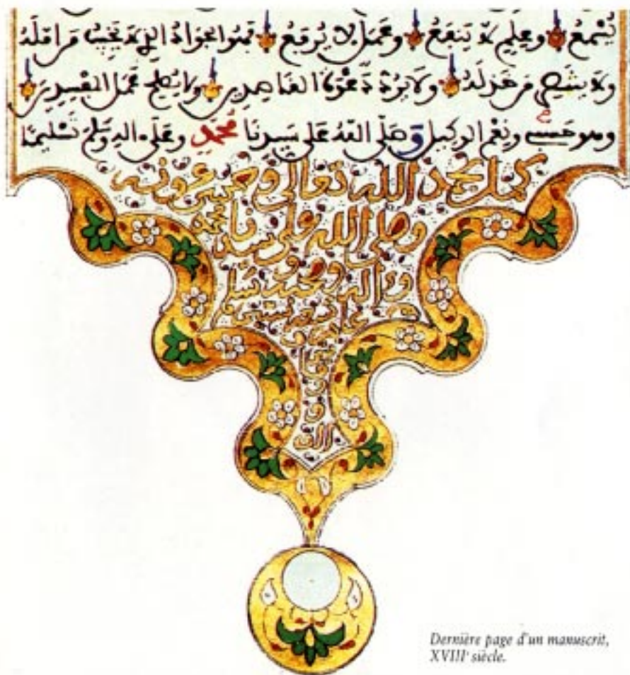
Dernière page d'un manuscrit, XVIII e siècle.

Conçue pour magnifier la calligraphie, elle a rehaussé de son éclat les livres religieux et certains écrits profanes. Avec l'extension de l'Islam, l'enluminure s'est enrichie de styles spécifiques aux différentes régions du monde musulman.