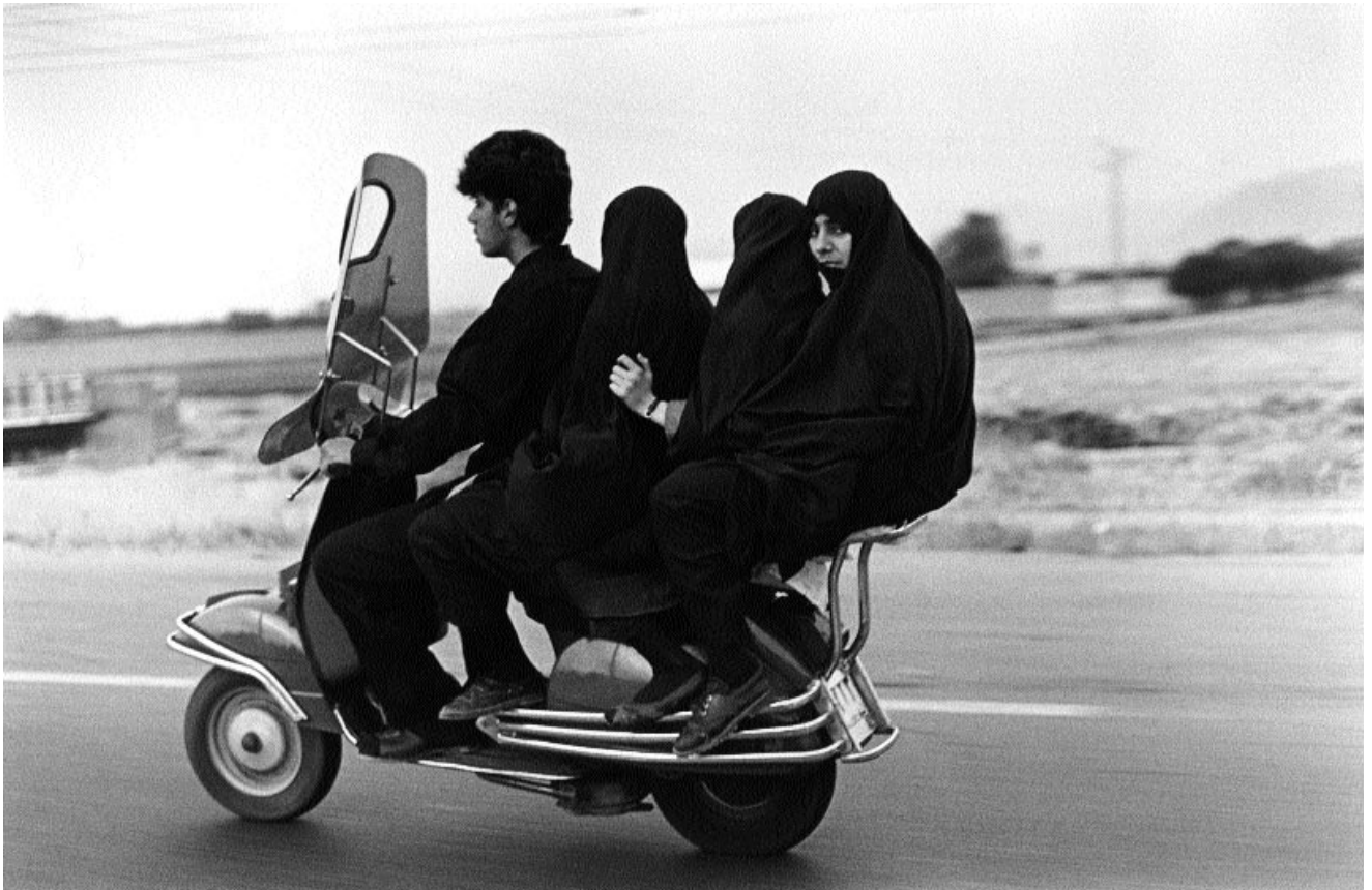
Téhéran, Iran